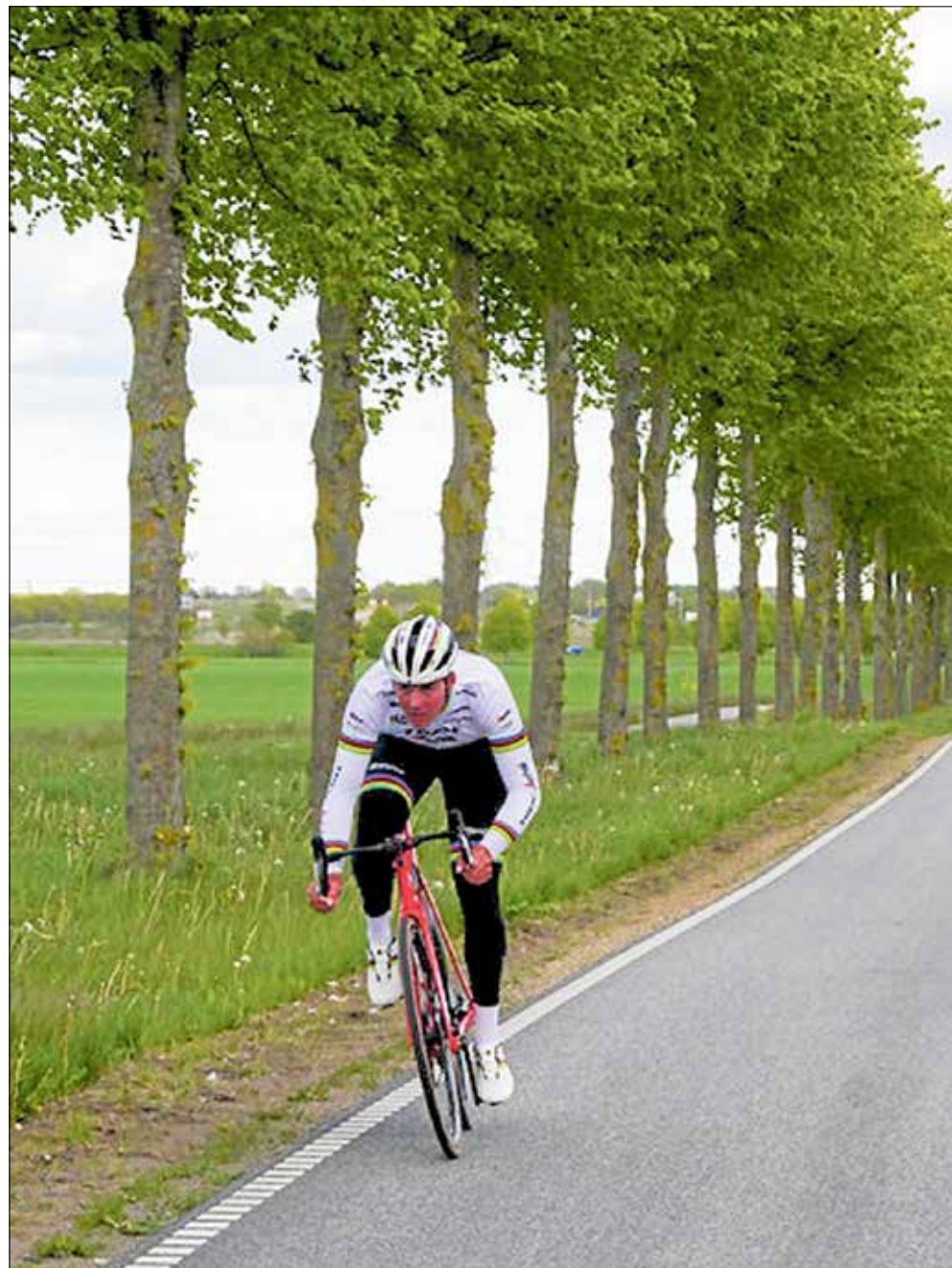
Verdensmesteren i landevejscykling, Mads Pedersen i fuld fart ned ad Ledreborg Allé i sin regnbuefarvede VM-trøje. Han har tidligere boet i Lejre by, nærmere bestemt Åvang.

Selvom der er over et år til tour-starten, så forbereder