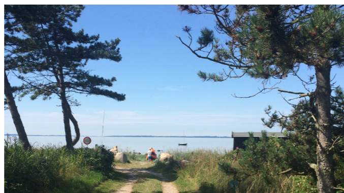
Kulhuse strand

skridt om dagen samt et større fokus på vores fysik og helbred, gør at mange kombinerer motionen i en lang vandretur med smukke naturoplevelser,” siger Thomas Kær Mahler.